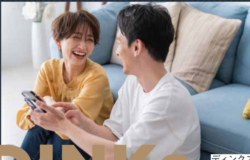
ディンクス ハウス